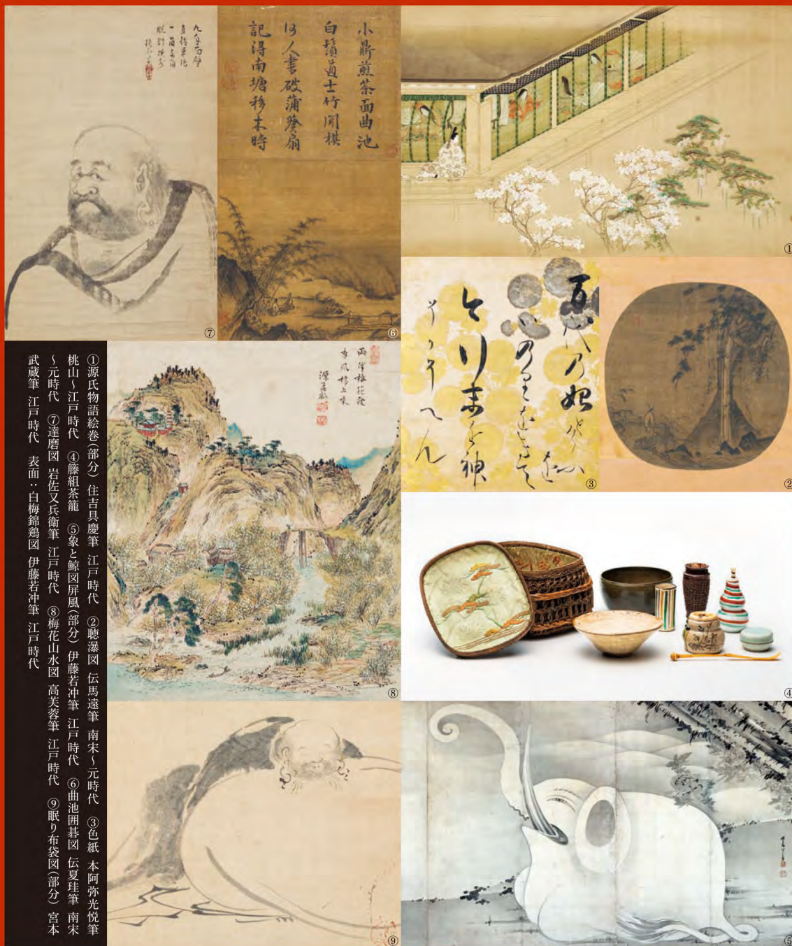
①源氏物語絵巻(部分) 住吉具慶筆 江戸時代 ②聴瀑図 伝馬遠筆 南宋・元時代 ③色紙 本阿弥光悦筆 桃山・江戸時代 ④藤組茶籠 ⑤象と鯨図 屏風(部分) 伊藤若冲筆 江戸時代 ⑥曲池開基図 伝夏珪筆 南宋・元時代 ⑦達磨図 岩佐又兵衛筆 江戸時代 ⑧梅花山水図 高美登筆 江戸時代 ⑨眠り布袋図(部分) 宮本武蔵筆 江戸時代 表面・白梅錦鶏図 伊藤若冲筆 江戸時代

MIHO MUSEUMは、1997年11月の開館以来、古代エジプトから西アジア、ギリシア・ローマ、南アジア、中国など、世界の古代美術に加え、わが国の古代から江戸時代にわたる工芸、彫刻、絵画など幅広い分野のコレクションを公開してきました。コレクション全体を展望してみると、形成される過程にはいくつかの画期がありました。本展覧会では、コレクションの形成過程を、茶道具を中心とした「黎明期」、MIHO MUSEUM開館に向けて大型の美術品が加わった「発展期」、そしてMIHO MUSEUM開館以後、美術館らしい大作が加わった「充実期」に分けてご覧いただきます。 半世紀をこえるMIHOコレクションの形成過程をふり返るとともに、30件を超える初公開作品を含めた、桃山から江戸時代の絵画をお楽しみください。